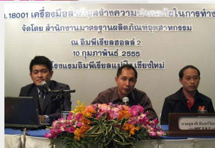
มอก.18001 เครื่องมือสำคัญสร้างความปลอดภัยในการทำงาน จัดโดย สำนักงานมาตรฐานผลิตภัณฑ์อุตสาหกรรม ณ อิมพีเรียลฮอลล์ 2 10 กุมภาพันธ์ 2555 โรงแรมอิมพีเรียลแม่ปิ้ง เชียงใหม่